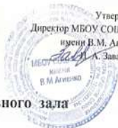
График проветривания спортивного зала (кабинет 3)